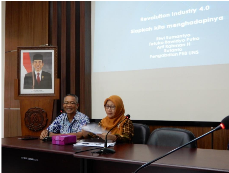
Gambar 3.3 Pembukaan oleh Ketua Pengabdian dan Ketua Program Studi Ekonomi Pembangunan