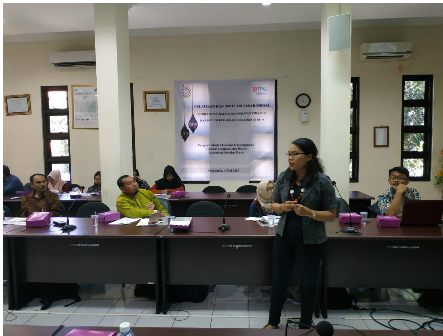
Gambar 3.4 Materi Investasi Pasar Modal oleh Ketua dan Anggota Pengabdian dan Mitra Pengabdian