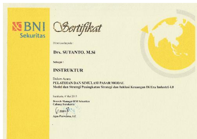
Gambar 3.5 Sertifikat dari Mitra untuk Ketua dan Anggota Pengabdian