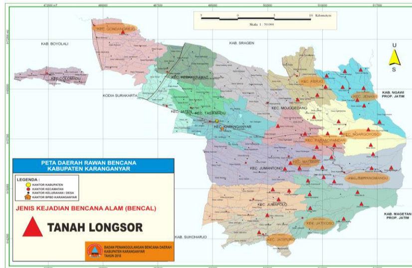
Gambar (Figure) 1. Peta Daerah Rawan Bencana Kabupaten Karanganyar (Map of Disaster-prone Areas of Karanganyar Regency)