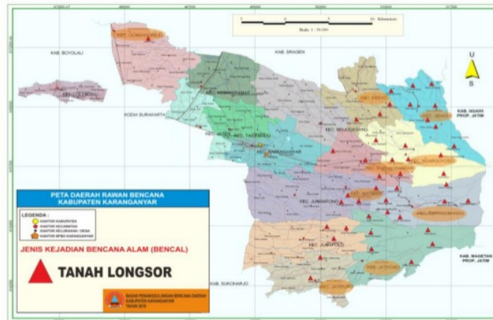
Gambar (Figure) 1. Peta Daerah Rawan Bencana Kabupaten Karanganyar (Map of Disaster-prone Areas of Karanganyar Regency)