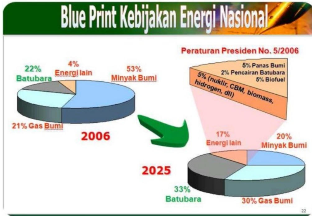
Gambar 1. Blue Print Kebijakan Energi Nasional